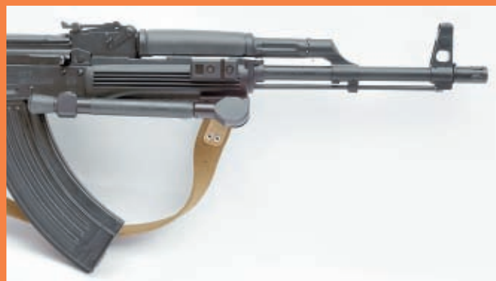
В сложенном состоянии сошка минимально выступает за габариты оружия

Для автомата Калашникова и большинства модификаций нарезной «Сайги» СТК предлагает комплект цевья и накладки цевья, которые позволяют без проблем оборудовать оружие одновременно коллиматорным прицелом, тактическим фонарём, лазерным целеуказателем,