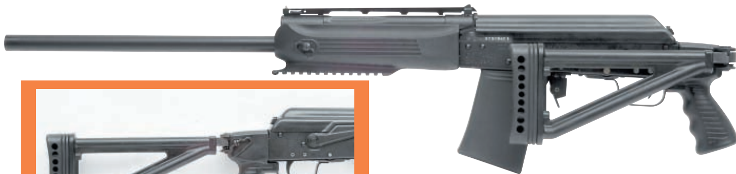
«Сайга-12/20» с новым цевьем и складывающимся прикладом приобретает совершенно новые качества, прежде всего, компактность. На этот приклад имеет смысл обратить внимание владельцам базовых вариантов «Сайги», поскольку в модификациях «С» приклад и так складывается

Очень интересный комплект имеется для классической гладкоствольной «Сайги» 12/20-го калибров. С помощью складывающегося приклада и нового цевья из длинного (и из-за этого неудобного в обращении) образца можно получить довольно компактное, удобное для перевозки и переноски оружие, которое может быть оснащено целеуказателем, фонарём и дополнительной