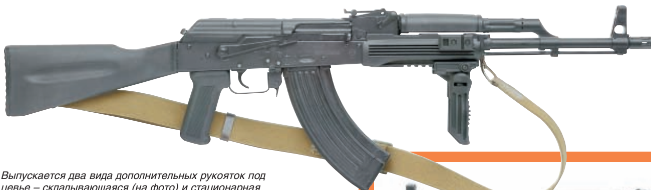
Выпускается два вида дополнительных рукояток под цевье – складывающаяся (на фото) и стационарная

рукояткой под цевье. Поскольку при установке нового цевья приходится снимать штатную антабку, на боковой поверхности цевья имеется антабка-дублёр.